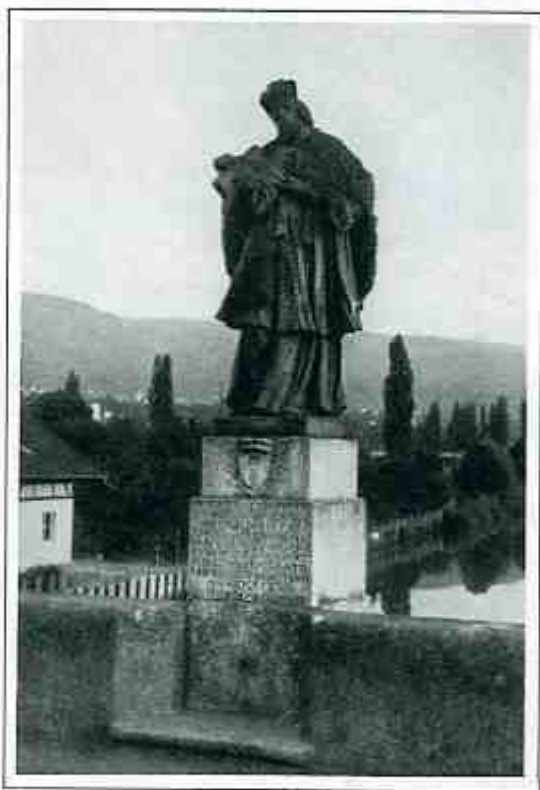
Standbild des heiligen Nepomuk auf der Birsbrücke bei Dornachbrugg